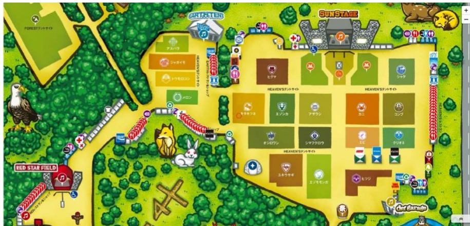
【同社が日本国内で提供した音楽フェスティバル RISING SUN ROCK FESTIVAL のオンラインマップ】