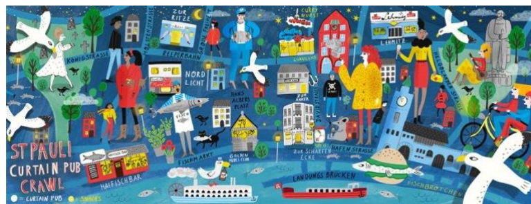
St Pauli Curtain Pub Crawl