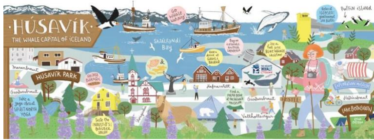
Húsavík, the Whale Capital of Iceland

タイトル「Húsavík, the Whale Capital of Iceland 作家: Rena Ortega (スペイン/バルセロナ)