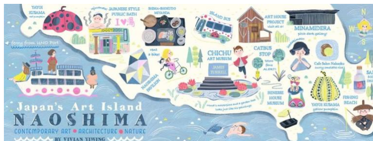
Naoshima: Japan's Art Island

タイトル「St Pauli Curtain Pub Crawl」 作家: Stephanie Hofmann (イギリス/ロンドン)